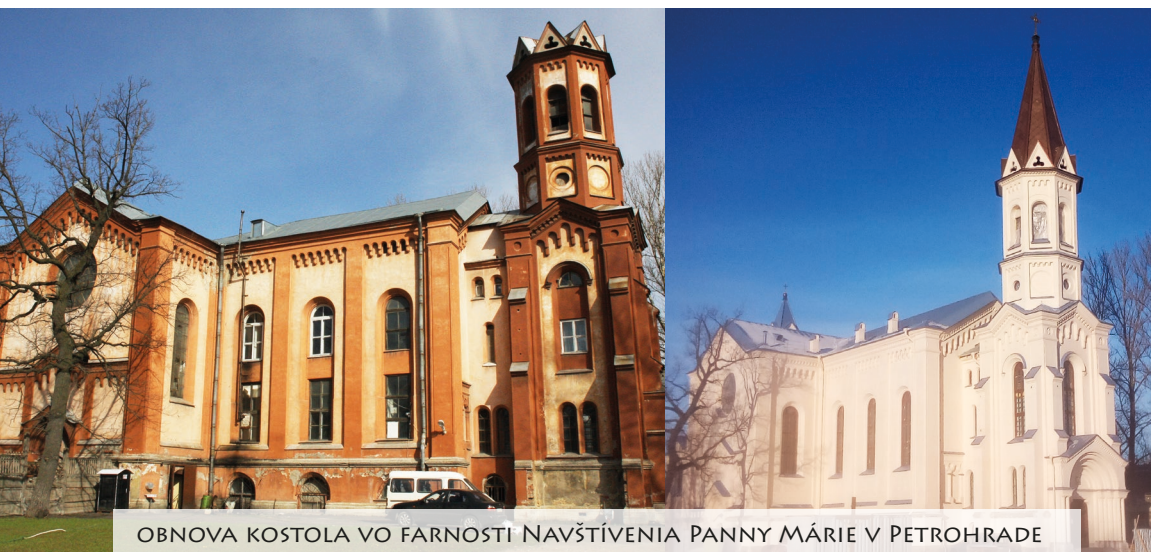
OBNOVA KOSTOLA VO FARNOSTI NAVŠTÍVENIA PANNY MÁRIE V PETROHRADE

Prvé tri roky som si vôbec nevedel zvyknúť, ale napokon som dodnes vďačný práve za túto farnosť. Mám možnosť vidieť ako sa upevňuje, buduje a rastie, a to duchovne aj fyzicky. Z dvadsiatky veriacich prvého roku vo farnosti máme dnes možnosť stretávať sa s viac ako 80-timi.