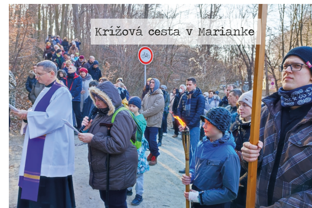
Križová cesta v Marianke