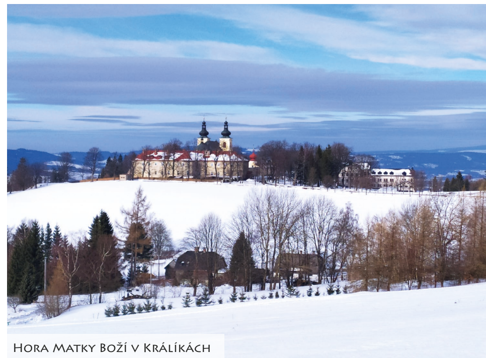
HORA MATKY BOŽÍ V KRÁLÍKÁCH