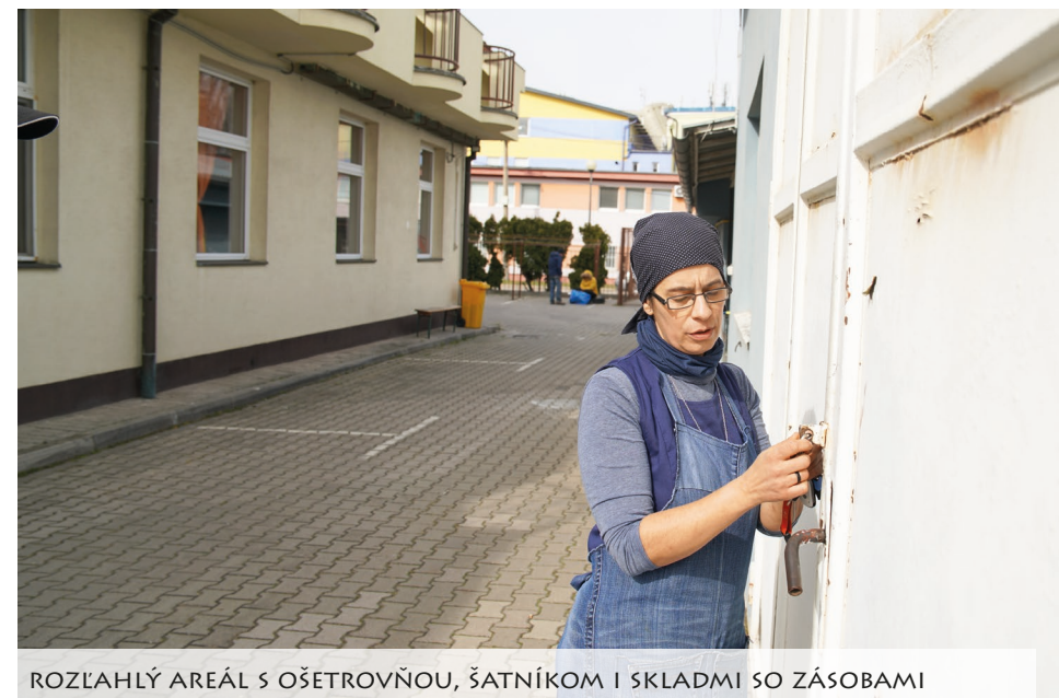
ROZLAHLÝ AREÁL S OŠETROVNŔOU, ŠATNÍKOM I SKLADMI SO ZÁSOBAMI

V poslednom čase bola za mnou asi dvakrát, ale bola som vždy zanepripravená, mala som práve na starosti prácu, ktorá bola prvotná, a tak som jej povedala: Potom... A to