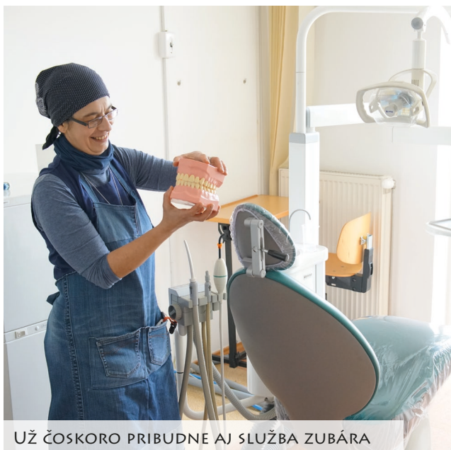
UŽ ČOSKORO PRIBUDNE AJ SLUŽBA ZUBÁRA

Čo je smutné a bolestné: umrelo nám veľmi veľa ľudí počas tohto roku. Naozaj veľa. Nevie, či len v dôsledku vírusu, alebo ľudia už boli vyčerpaní z celej situácie. Nosím tiež v srdci jednu bolesť: s jednou pani, folkloristkou, ktorá žila niekoľko rokov na ulici, sme sa postupom času zblížili. Vtedy som ešte nebola v kuchyni a spoznali sme sa, keď som ju ošetrovala. Tu je ešte jedna zaujímavosť: cez ošetrovanie - tak som to vnímala - keď som sa dotýkala tela, rán (väčšinou sme vyberali stehy, zalepovali, ošetrovali rozbité hlavy, kolená...), keď som sa dotýkala ľudí, oni sa vtedy vedeli aj otvoriť.