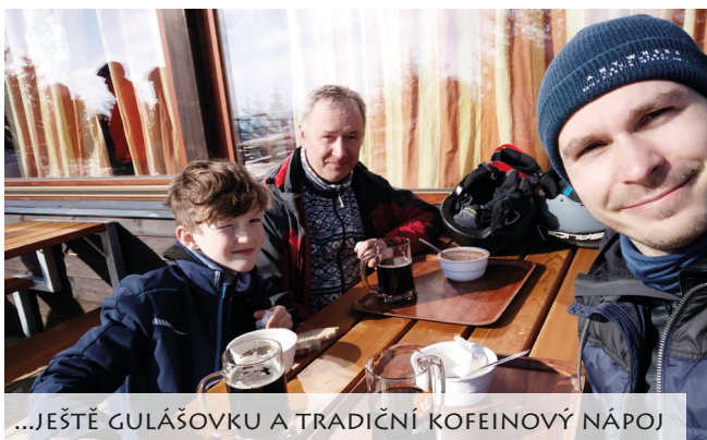
...JEŠTĚ GULÁŠOVKU A TRADIČNÍ KOFEINOVÝ NÁPOJ

Někdy mě „vyučí“ i člověk, který v podstatě jen prochází kolem. Pochopil jsem, že je potřebné naučit se slyšet ve zvuku farního zvonku Ježíšovo klepání na dveře mého srdce. Občas zazvoní potřební, kteří chtějí něco k jídlu, jindy zazvoní pán ověšený růženci a s igelitkou v ruce, že