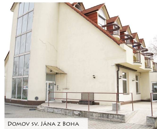
DOMOV SV. JÁNA Z BOHA

Preto sv. Jána z Boha, lebo centrum patrí a bolo zriadené rehoľou milosrdných bratov: sv. Ján z Boha je ich zakladateľ aj patrón. A prečo domov? Lebo cieľom centra je vytvoriť skutočne domov pre ľudí, ktorí tu prichádzajú - aspoň na tých pár hodín. Myslím si, že budova je na to dobre zariadená a snažíme sa tu vytvárať takú atmosféru.