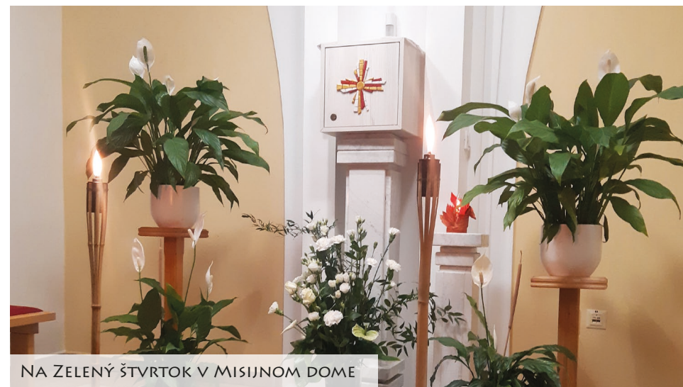
NA ZELENÝ ŠTVRTOK V MISIJNOM DOME