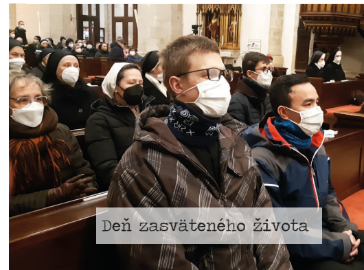
Deň zasväteného života