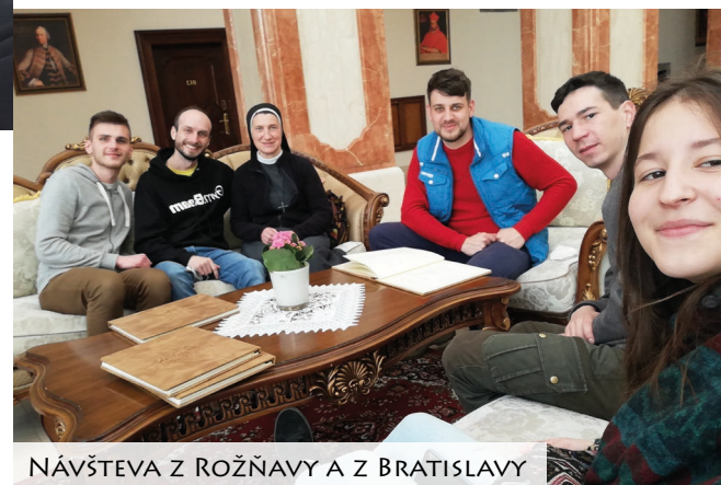
NÁVŠTEVA Z ROŽŇAVY A Z BRATISLAVY

Mohli sme sa realizovať napríklad pri orezávaní okrasných a ovocných stromov, či pri vytváraní záhonu a vonkajších úpravách. Tiež sme v noviciáte mohli privítať nové tváre - rehoľné sestry, ktoré si tu vykonávali duchovné cvičenia, a ktoré nás povzbudili vlastným svedectvom života.