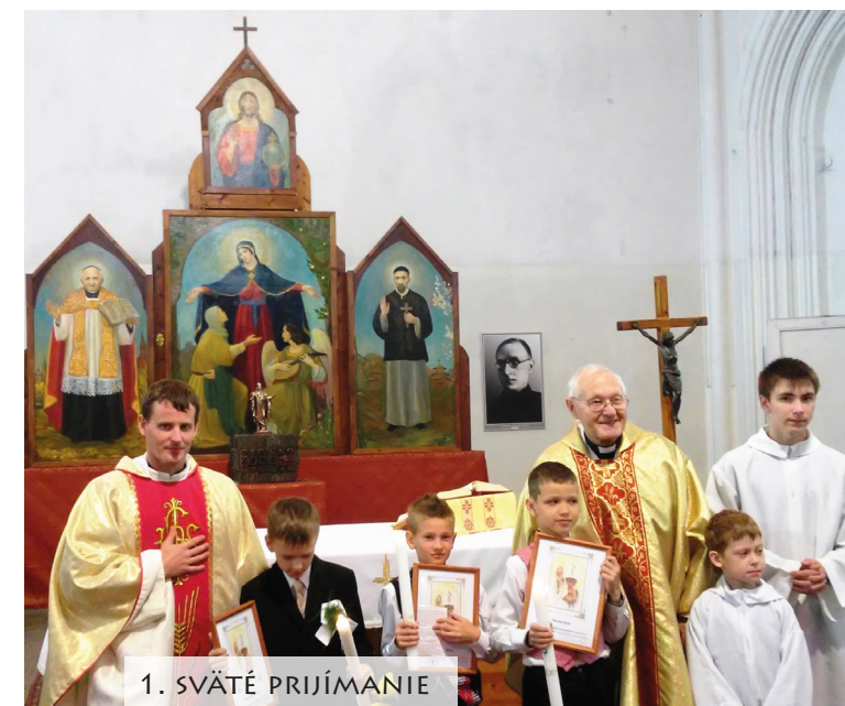
1. SVÄTÉ PRIJÍMANIE

Čitateľom Mladého misionára chcem odkázať len jedno, aby videli Rusko a Rusov, alebo „Rossijan“ (t.j. všetky národnosti žijúce v Rusku), ako ľudí krajnej obetavosti, a neľadeli na nich cez prizmu zbohatlíkov vykrikujúcich na brehoch francúzskej riviéry. Tento národ veľa zniesol a ešte veľa znesie, aj napriek nenávisti, ktorá sa pre známe príčiny šíri svetom. Oni sa mi stali rodinou, a ako neďám dopustiť na svojich doma na Spiši, tak ani na tých od Kaliningradu po Vladivostok.