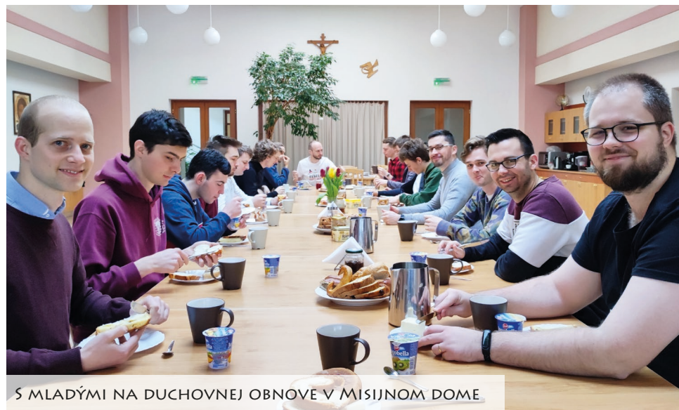
S MLADÝMI NA DUCHOVNEJ OBNOVE V MISIJNOM DOME

Ak pôjde všetko podľa plánu, 8. septembra 2022 zložím svoje doživotné sľuby, zrejme na Kalvárii v Nitre. Srdečne vás pozývam.