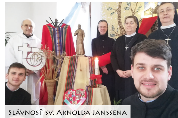
SLÁVNOSŤ SV. ARNOLDA JANSSENSA

V druhej polovici januára sa naša komunita rozrástla o piatich operených členov,