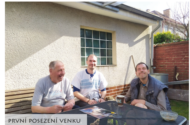
PRVNÍ POSEZENÍ VENKU

Když se tohle všechno daří tak se mohou těšit obrovské vděčnosti z mé návštěvy. Pro tu není potřeba připravovat náročný, hluboce teologický program. Přesto se však připravit musím, protože tito bratři a sestry snadno