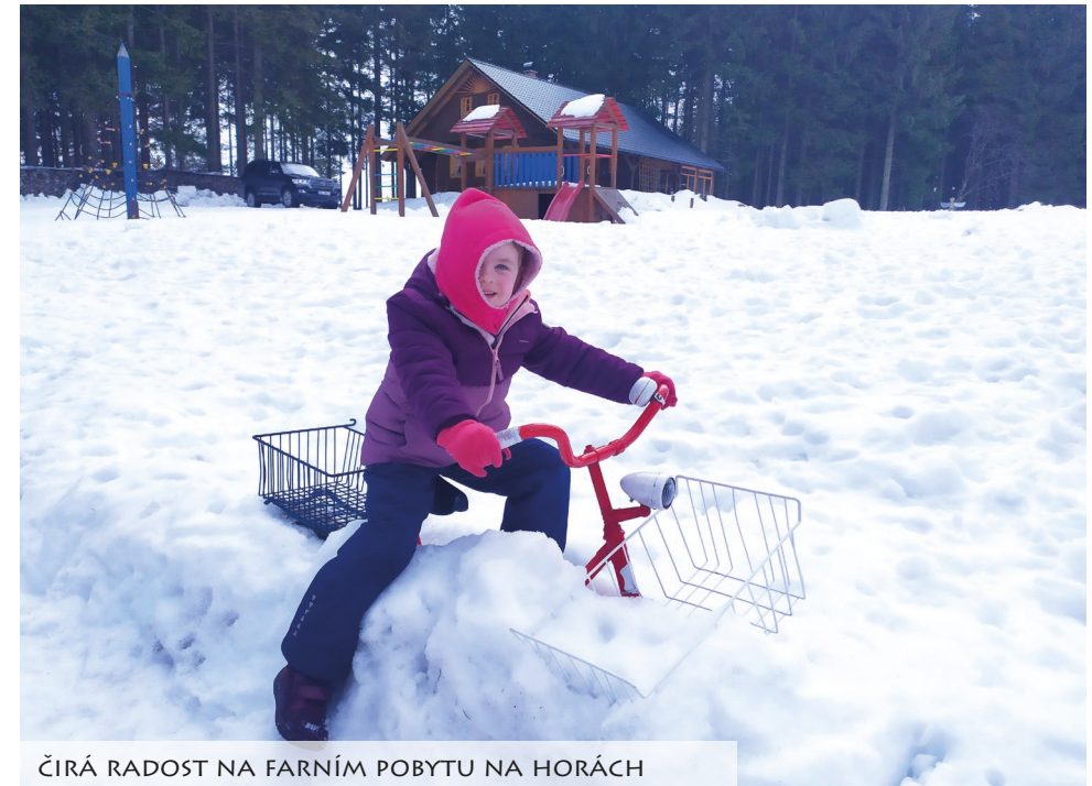
ČIRÁ RADOST NA FARNÍM POBYTU NA HORÁCH

to pro mne velmi delikátní služba, ve které se člověk musí učit nejen pochopitelné dávce trpělivosti, ale i mnoha jiným věcem. Například takový multitasking (zvládání více úloh najednou). Stává se zde téměř pravidlem, že mluvíme všichni najednou. To vypadá v praxi tak, že odpovídám na jeden dotaz, do toho jsou mi zpěvem představovány osoby na fotografiích, je pokládána další otázka a také odpovídám na několikátý pozdrav dodatečně přichozího. Další výzvou v této pastorační bylo naučit se citlivě volit slova. Když jsem je volil neopatrně, stávalo se, že se někteří klienti chráněného bydlení snadno rozrušili. Rovněž si musím stát za svými