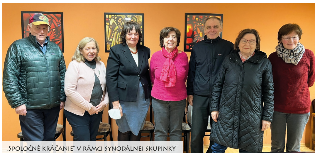
„SPOLOČNÉ KRÁČANIE“ V RÁMCI SYNODÁLNEJ SKUPINKY