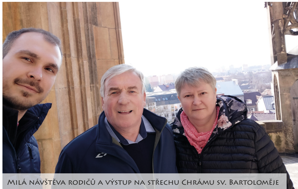
MILÁ NÁVŠTĚVA RODIČŮ A VÝSTUP NA STŘECHU CHRÁMU SV. BARTOLOMĚJE

Jednou mi při rozloučení a velmi pevném stisku ruky říká něco, z čeho rozumím pouze „děkuju, nechal jste mě hezčím“. (Ne)obvyčejná věta od člověka, od kterého ji člověk nečeká. Duch vane, kam chce. Dlouho jsem nad jeho slovy přemýšlel - několikrát se mi vrátila na mysl. A vedla mě k otázce, jak my si vážím devocionálií, zbožných časopisů a knih? Uvědomuji si, že mě můžou „nechat hezčím“, lepším člověkem a bližším Bohu?