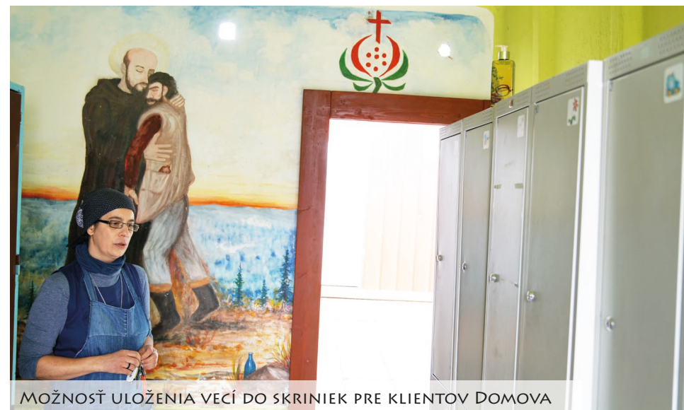
MOŽNOSŤ ULOŽENIA VECÍ DO SKRINIEK PRE KLIENTOV DOMOVA

Absolútne nie. Doma sa mi smiali, že idem do kláštora a variť neviem. Nie, variť som nevedela vôbec, niečo som sa naučila až počas rokov v kláštore. Ale dnes varím rada a baví ma to. Mám nejaké svoje recepty, ale nerobím nič špeciálne. Pritom varím z toho, čo mám k dispozícii.