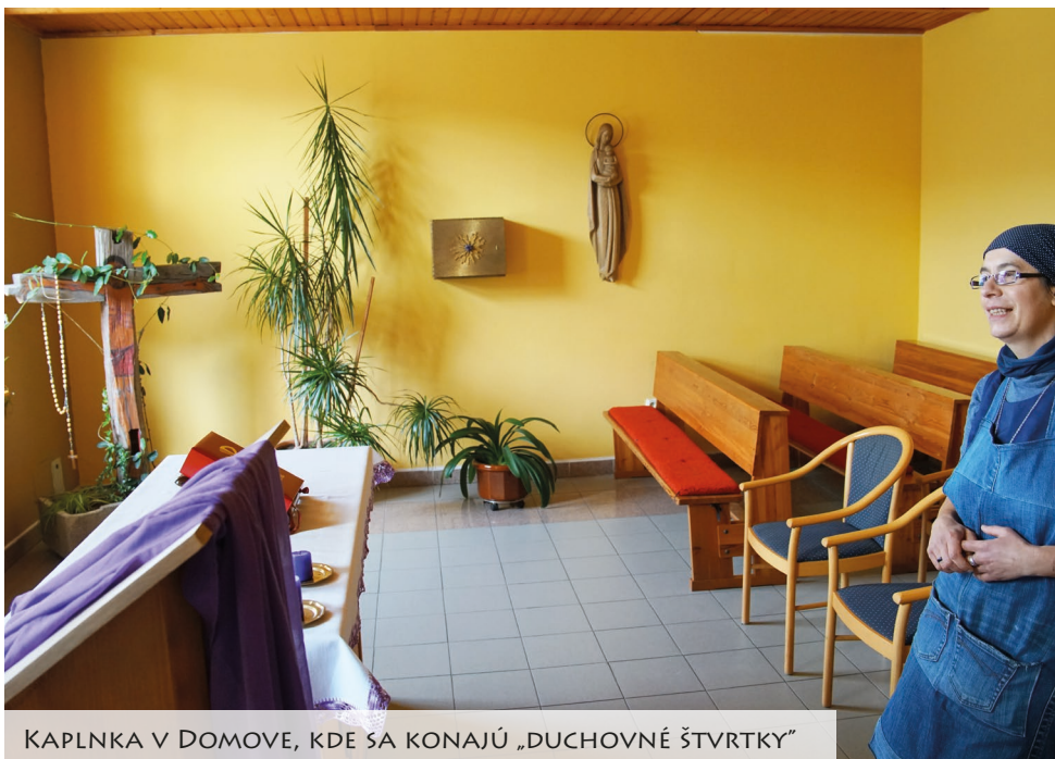
KAPLNKA V DOMOVE, KDE SA KONAJÚ „DUCHOVNÉ ŠTVRTKY“