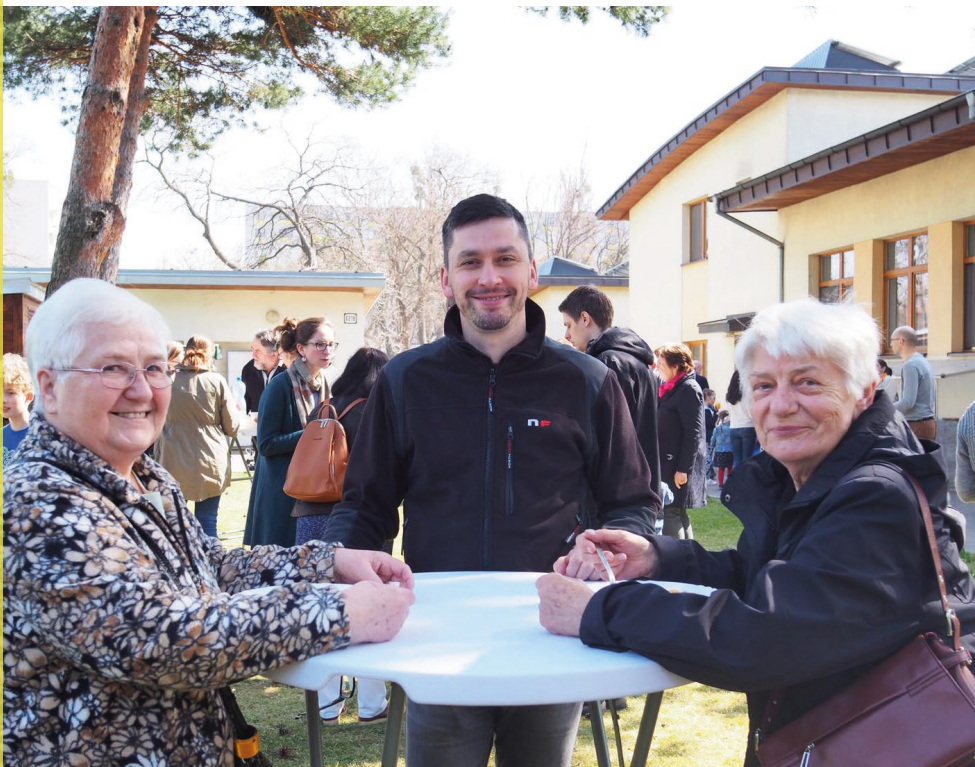
Milovaní v Kristovi,