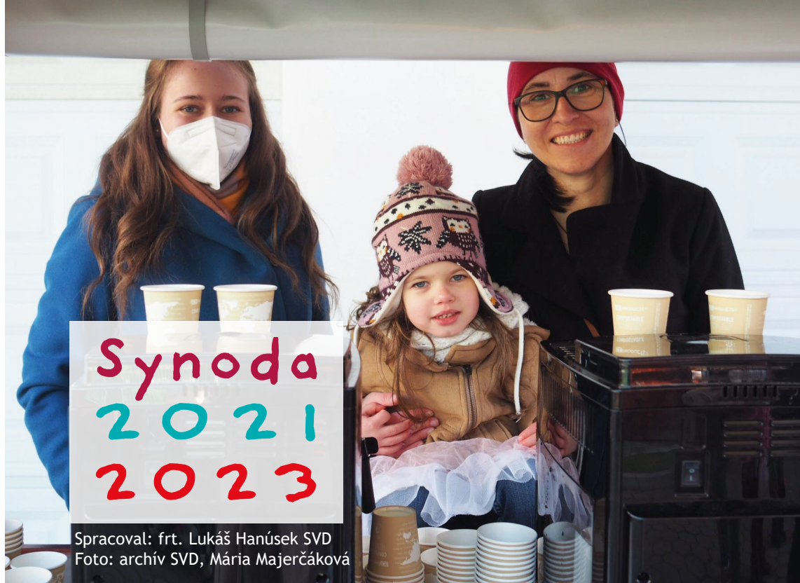
Spracoval: frt. Lukáš Hanúsek SVD

PÁPEŽ FRANTIŠEK OHLÁSIL 7. MARCA 2020 SYNODU BISKUPOV NA TÉMU: ZA SYNODÁLNU CIRKEV: SPOLOČENSTVO, PARTICIPÁCIA A MISIA. TRI ROKY TRVAJÚCI PROCES KONZULTÁCIÍ, MODLITIEB A ROZLIŠOVA- NIA VYVRCHOLÍ GENERÁL- NYM ZHROMAŽDENÍM V OKTÓBRI 2023 V RÍME.