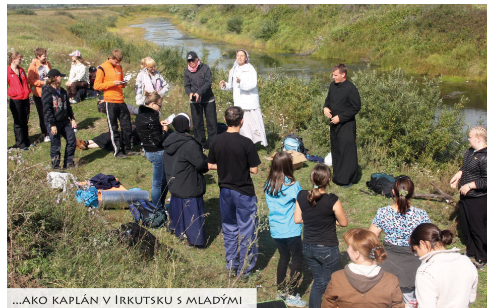
...AKO KAPLÁN V IRKUTSKU S MLADÝMI