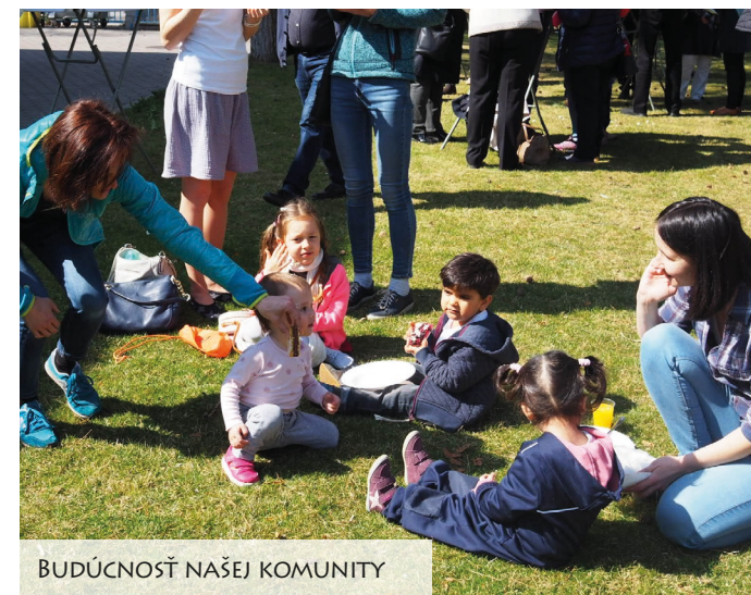
BUDÚCNOSŤ NAŠEJ KOMUNITY

návrhov, ktoré vyjdú zo stretnutí moderátorov a ktoré my koordinátori spracujeme do správy a odošleme arcidiecéze do konca mája, resp. polovice júna 2022.