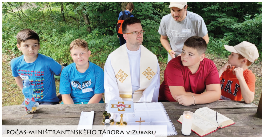
POČAS MINIŠTRANTNSKÉHO TÁBORA V ZUBÁKU

Sv. Otec František hovorí: „Buď si istý, že ak spoznáš Božie volanie a budeš ho nasledovať, bude to niečo, čo dá tvojmu životu plnosť.“