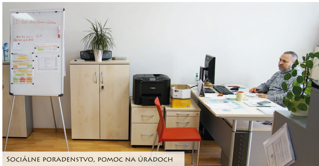
SOCIÁLNE PORADENSTVO, POMOČ NA ÚRADOCH