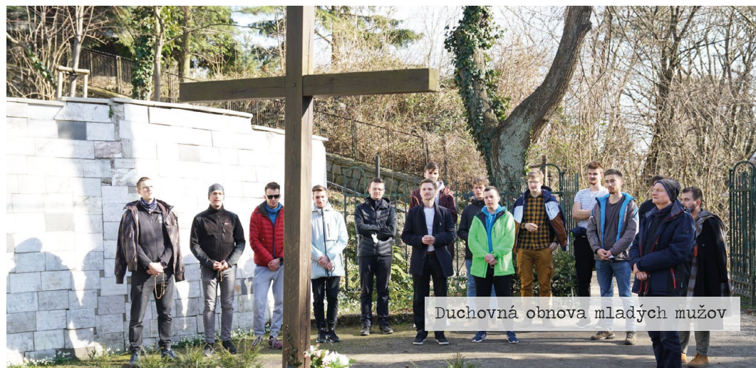
Duchovná obnova mladých mužov