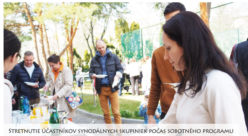
STRETNUTIE ÚČASTNÍKOV SYNODÁLNYCH SKUPINIEK POČAS SOBOTNÉHO PROGRAMU

kráčať pod vedením Ducha Svätého. Synoda nás otvára pre živú skúsenosť účasti, rozlišovania a spoluzodpovednosti. Sme pozvaní hľadať riešenia tak, že dáme slovo Bohu a jeho hlasu uprostred nás. A to je nádherná výzva, nie?