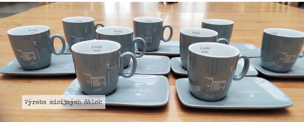
Výroba misijných šálok