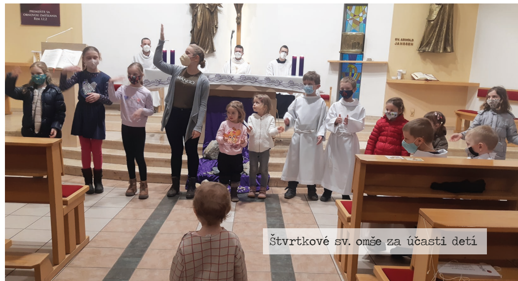
Štvrtkové sv. omše za účasti detí