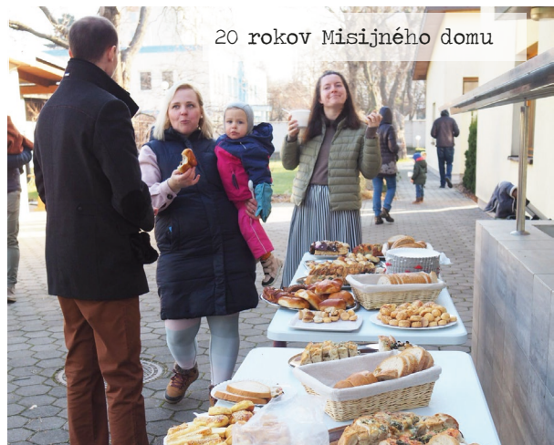
20 rokov Misijného domu