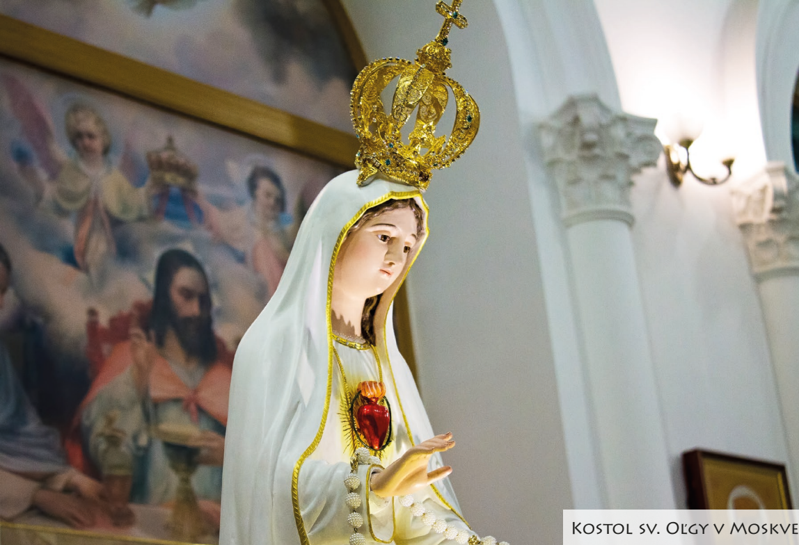
KOSTOL SV. OLGY V MOSKVE