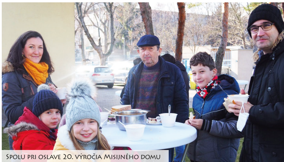
SPOLU PRI OSLAVE 20. VÝROČIA MISIJNÉHO DOMU

nám síce dali z arcidiecézy, ale každý koordinátor si to potreboval nastaviť podľa života vo farnosti, kde pôsobí.