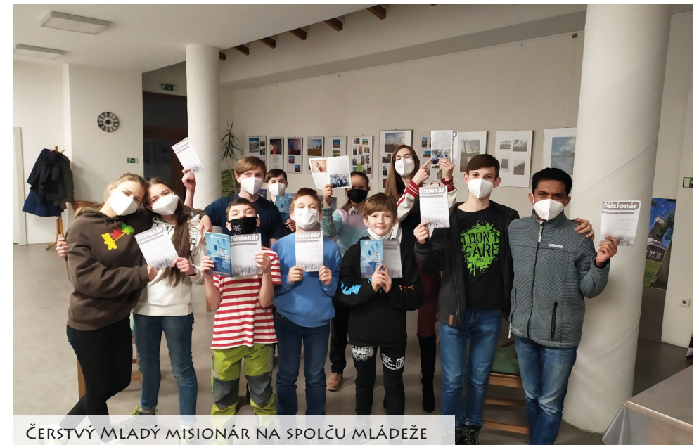
ČERSTVÝ MLADÝ MISIONÁŘ NA SPOLČU MLÁDEŽE